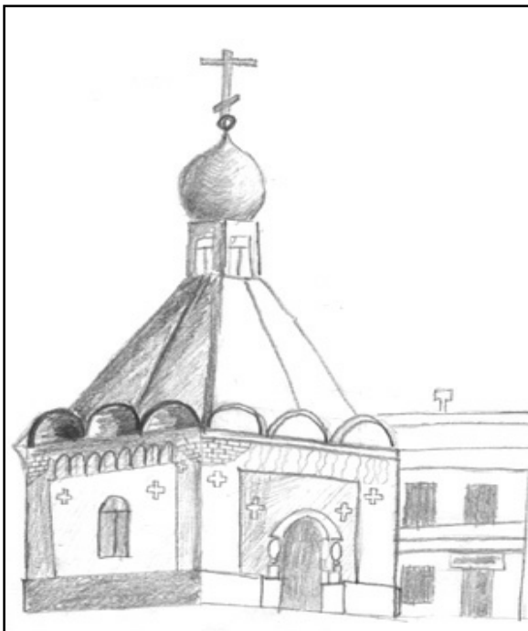
Часовня Филиппа Иранского рис. Ибрагимов Дмитрия

Есть еще и практические неудобства от «летающих» волос. В общественном транспорте, берясь за поручень, мне приходилось ненароком зацеплять руками прядь волос девушки и причинять ей боль, когда она делала движение голо-